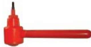
Drehmomentschlüssel 20Nm Einsatz SW5 Einsatz SW6 Best.-Nr. 620 147 Best.-Nr. 620 148 Best.-Nr. 620 149