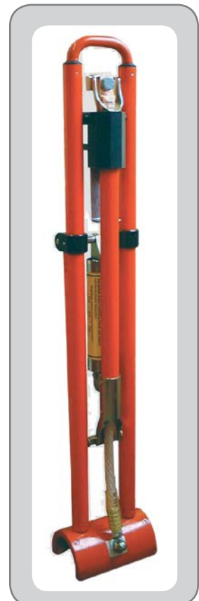
Abb. Bauform B